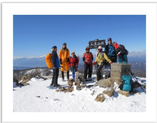
入笠山山頂に立つ