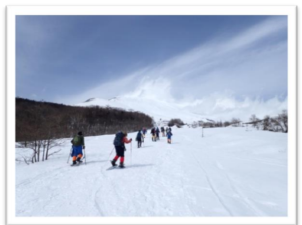
昨年度 富士山太郎坊でのスノーシューハイク