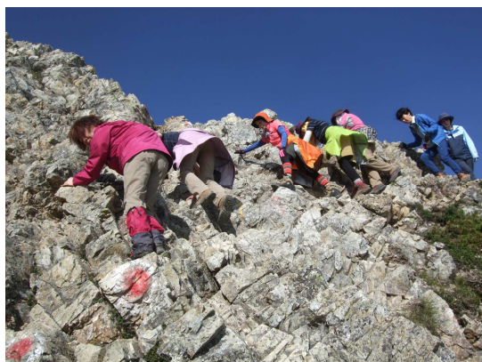
ちょっとスリリングな岩場の通過