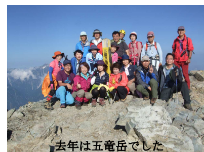
去年は五竜岳でした

全くの初心者でも大丈夫。県岳連所属山岳会のベテランがご案内します。あなたも行ってみませんか。針ノ木岳へ。