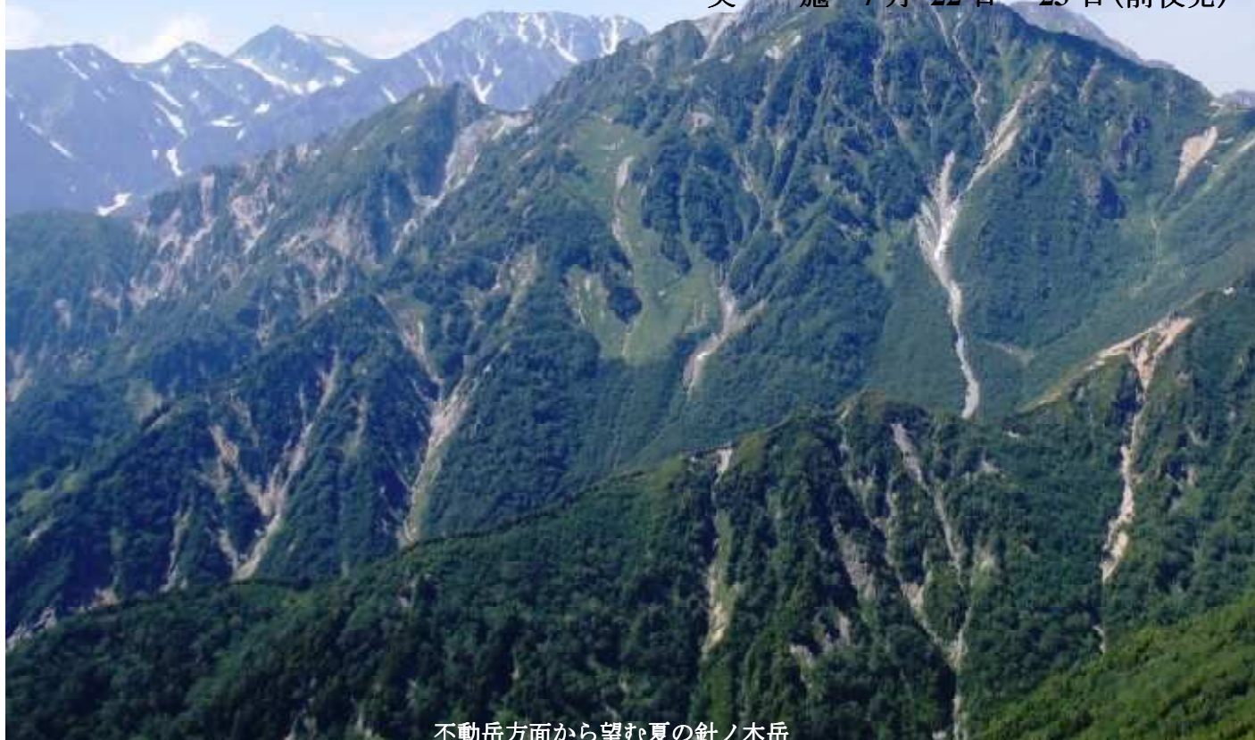
不動岳方面から望む夏の針ノ木岳

静岡県山岳連盟主催の夏山登山教室、5回目の今年は北アルプスの針ノ木岳(2821m)と蓮華岳(2799m)に登ります。大雪渓を登って針ノ木岳へ、そして、蓮華岳ではコマクサの大群落があなただけを迎えてくれます。