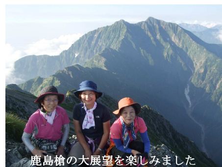
鹿島槍の大展望を楽しみました